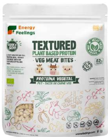
TACOS DE CARNE VEGETAL ECO