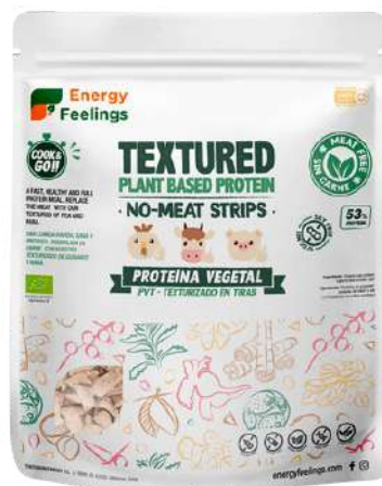
TIRAS DE CARNE VEGETAL ECO