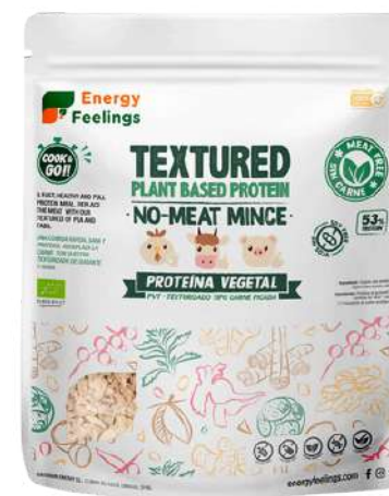
CARNE PICADA VEGETAL ECO