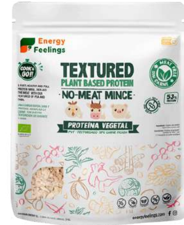
CARNE PICADA VEGETAL ECO