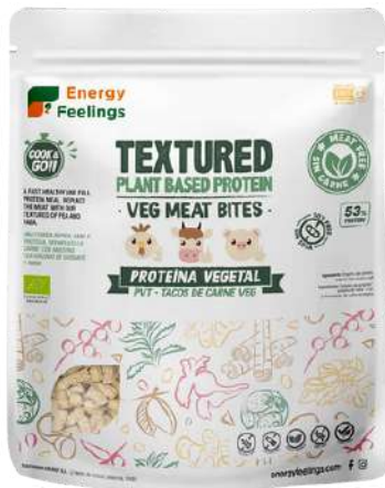
TACOS DE CARNE VEGETAL ECO